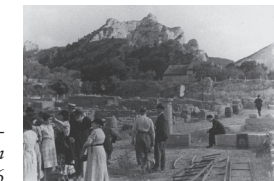
Die Ausgrabungen im Jahre 1936

Im 7. und 6. Jh. v. Chr. ließen sich die ersten Bewohner im Schutz eines Trockensteinwalls nieder, der den Weg durch die Alpillen über 300 m