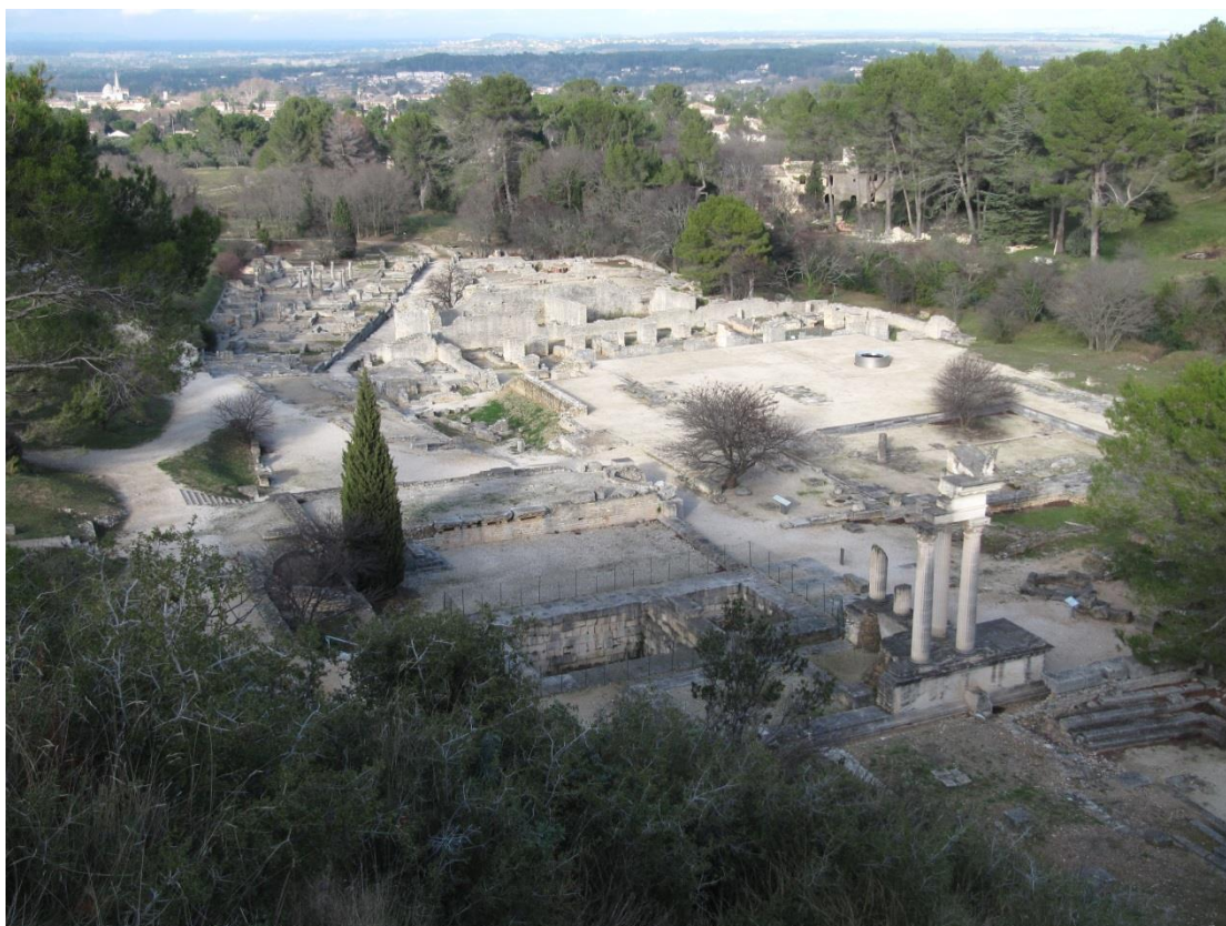
Site archéologique de Glanum

La cité antique de Glanum est ouverte au public par le Centre des monuments nationaux et a accueilli 70 000 visiteurs en 2022 et 2023.