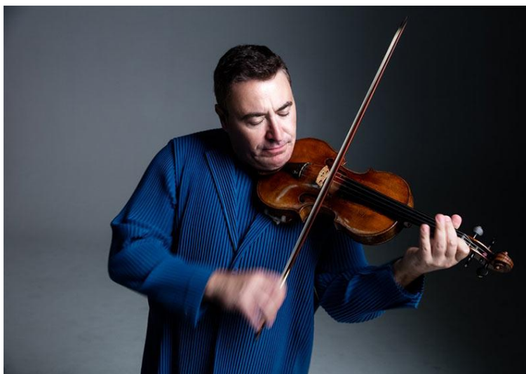
Maxim Vengerov © 2022-2025

Du 17 au 19 juillet , le Festival de Glanum, fidèle à sa tradition, proposera un programme placé sous le triple signe de l'ouverture, de l'éclectisme et plus que jamais, de l'excellence.