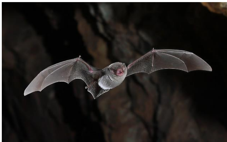
Minioptere de schreibers