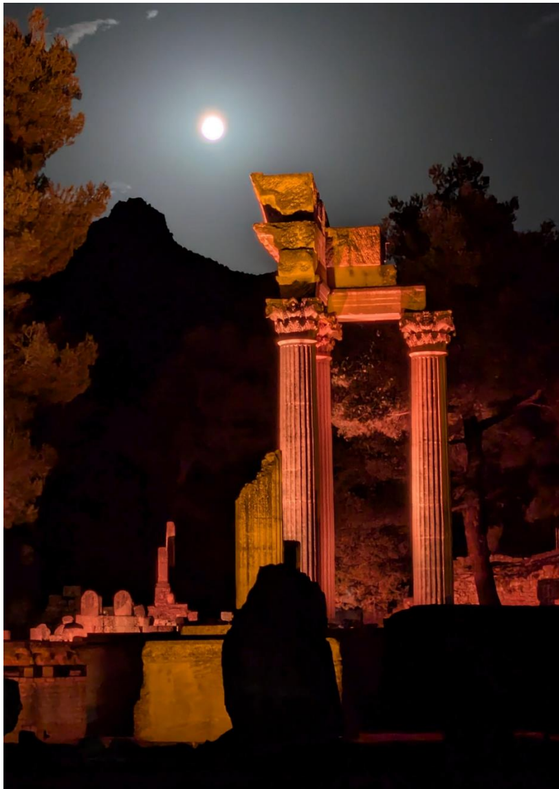
Site archéologique de Glanum

au site archéologique de Glanum, à Saint-Rémy-de-Provence